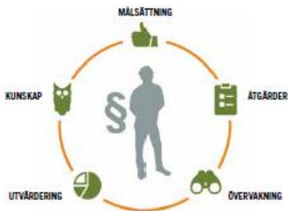
Fig 3. Schematisk bild över adaptiv förvaltning 21 .

Adaptiv förvaltning bygger också på att man involverar de intressenter som berörs av mål och åtgärder i beslutsfattandet. Fördelarna med det är att både vetenskaplig och mer erfarenhetsbaserad kunskap kommer till nytta. Det lokala deltagandet och möjligheten att påverka ökar också acceptansen hos de berörda intressenterna så att åtgärder och regler verkligen efterlevs.