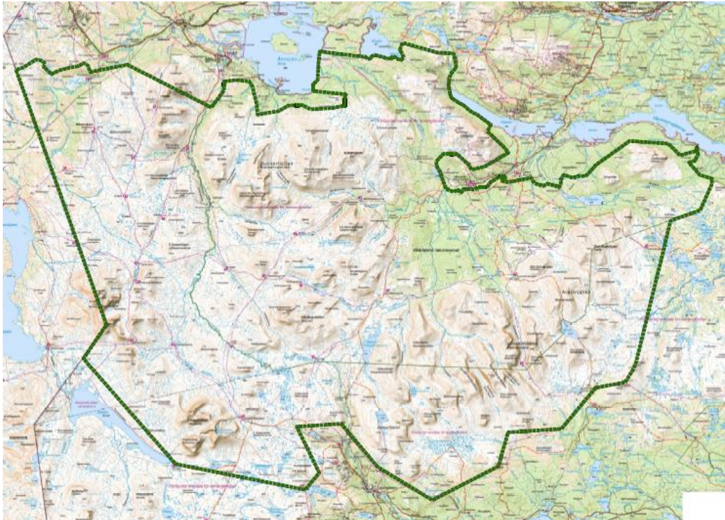
Fig 2. Preliminär gräns för nationalparken.

förutsättningar för att utvidga området något i öster 10 . Även andra, mindre, justeringar av gränsen kan bli aktuella.