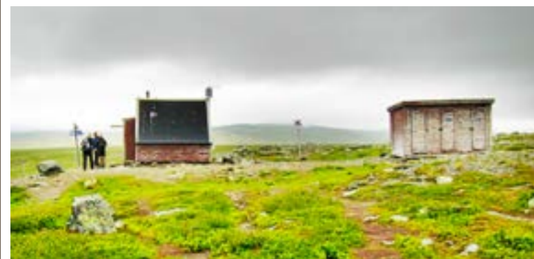
Utredningen syftar också till att se över vindskydd och ledcentraler i hela området.

PREMIUM När du har aktiverat ditt konto på ltz.se får du tillgång till e-tidningen, allt premiuminnehåll på webben samt specialutgåvor av e-tidningar. Du får även rabatt på direktsända matcher.